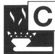
Gasförmige Stoffe, auch unter Druck