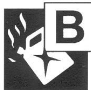
Flüssige oder flüssig werdende Stoffe