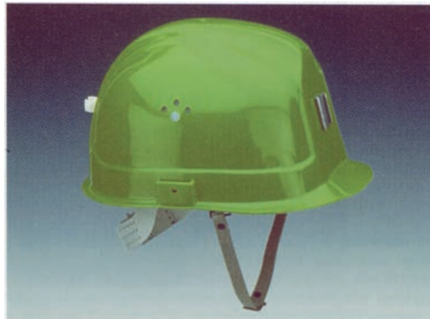
Bild 3: Industrieschutzhelm mit verkürztem Schirm, Lampen- und Kabelhalter, Kinnriemen (Zubehör)