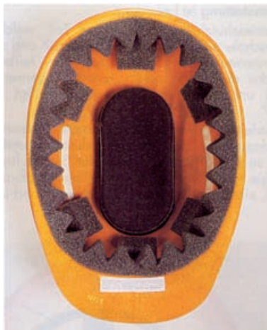
Bild 8: Industrieschutzhelm für Kopfverletzte mit Schaumstoff-Innenausstattung