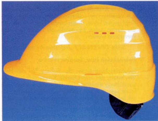
Bild 2: Industrieschutzhelm mit heruntergezogenem Nackenteil, Belüftungsöffnungen und seitlichen Schlitten zur Befestigung von Zubehör (z.B. Gehörschützer), jedoch ohne Regenrinne