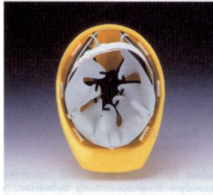
Bild 9: Industrieschutzhelm für Kopfverletzte mit Zackenleder-Innenausstattung

Dies sind z.B. Kinnriemen, Leuchtenhalter, Nackenschutz, Schutzschirme, die ohne eigene Tragevorrichtung ausschließlich in Verbindung mit geeignetem Kopschutz getragen werden können.