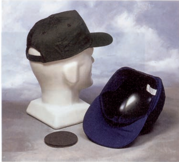
Bild 6: Industrie-Anstoßkappe mit textiler Umhüllung als Schirmmütze