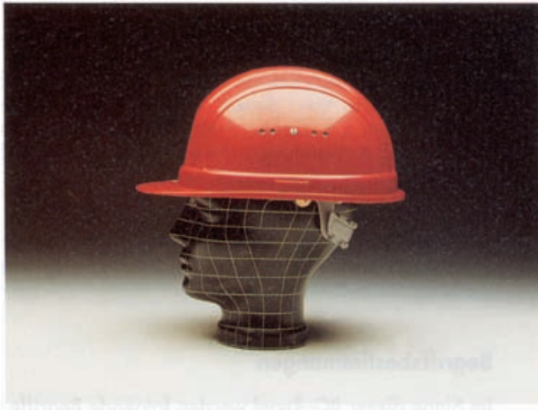
Bild 1: Industrieschutzhelm mit Regenrinne, Belüftungsöffnungen und seitlichen Stecktaschen zur Befestigung von Zubehör (z.B. Gehörschützer)